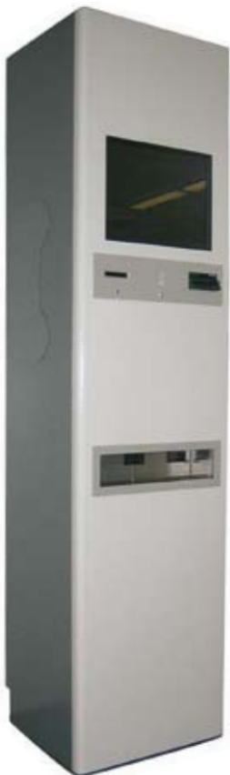
Medial Service-Terminal – Design