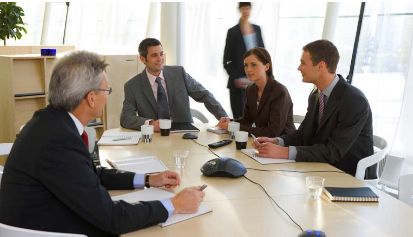
Conference phones for every situation