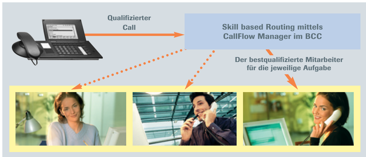
Routing eines qualifizierten Calls

Ihrer Kundenbetreuung. Eine BCC Lösung ermöglicht auch den parallelen Einsatz von Anrufverteilung und Skill based Routing.