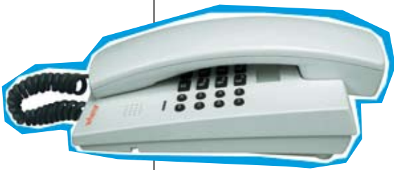
Analoges Gasttelefon Integral E3