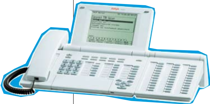
Integral T3 Comfort mit DSS Modul