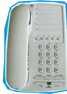
Analoges Gasttelefon HoTel5