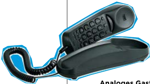
Analoges Gasttelefon KB22