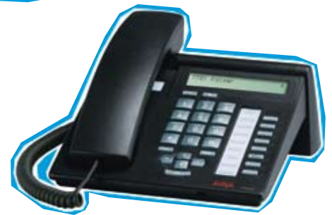
Digitales Gasttelefon Integral T3 Compact