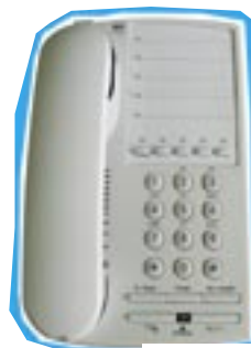
Analoges Gasttelefon HoTel5