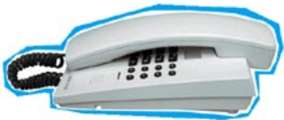
Analoges Gasttelefon IntegralE3