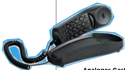
Analoges Gasttelefon KB22