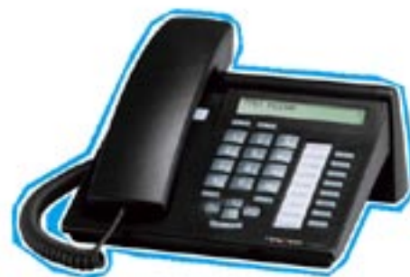
Digitales Gasttelefon Integral T3 Compact