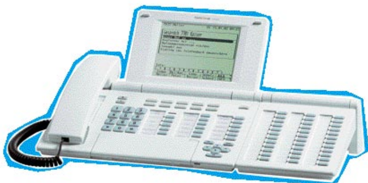
Integral T3 Comfort mit DSS Modul