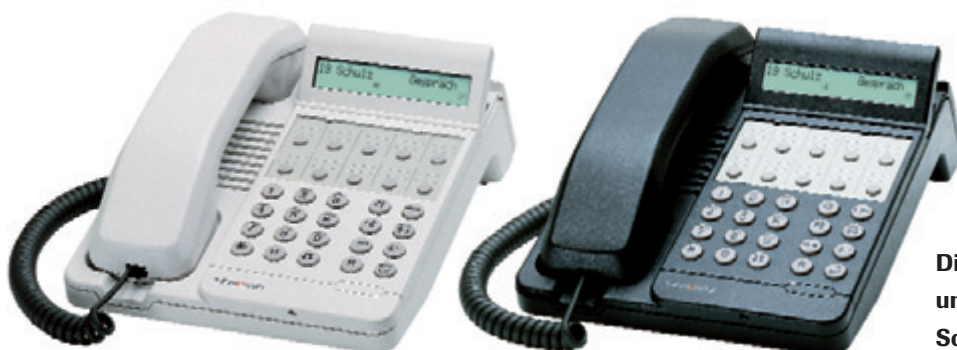
Die Systemtelefone TS 53 und TS 53-PC sind in Schwarz und Weiß erhältlich

höchst flexibel und vor allem kostengünstig ist: die Integral 1. Und mit den Systemtelefonen TS 53 und TS 53-PC bieten wir Ihnen die passenden Telefone, um alle Stärken dieses kleinen Kommunikationswunders nutzen zu können.