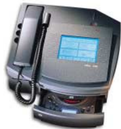
Das Voice-Mail-System Memo von Tenovis für noch mehr Erreichbarkeit

Falle der vollständigen Auslastung Ihres Servicepersonals. Wartezeiten können mit einer Musikeinspielung überbrückt werden. Die anschließende Anrufverteilung erfolgt automatisch. Die Kommunikation mit dem Anrufer kann sowohl über Tastatureingaben als auch per Sprache erfolgen. So werden die Anrufe Ihrer Kunden zielgerichtet zum entsprechenden Serviceplatz weitergeleitet. Das hilft Ihnen, das tägliche Gesprächsaufkommen effizient zu bewältigen und Ihre Kunden immer freundlich zu empfangen.