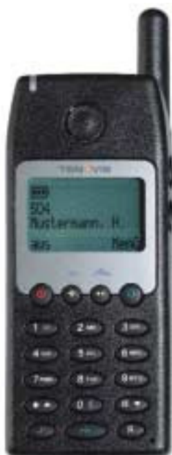
Schnurlos im Haus erreichbar: mit dem DECT-Handset MM 588 von Tenovis

Eine hohe Erreichbarkeit wird durch die Roaming-Funktion realisiert. Beim Einschalten des Mobilteils nimmt das System automatisch sofort Verbindung zur stärksten Funkzelle auf. Egal, wo Sie sich auf dem Firmengelände gerade befinden, das System nimmt unmittelbar Verbindung zum Mobiltelefon auf und signalisiert ankommende Anrufe binnen kürzester Zeit. So bleiben alle Mitarbeiter auch untereinander stets unter der eigenen Durchwahl erreichbar.