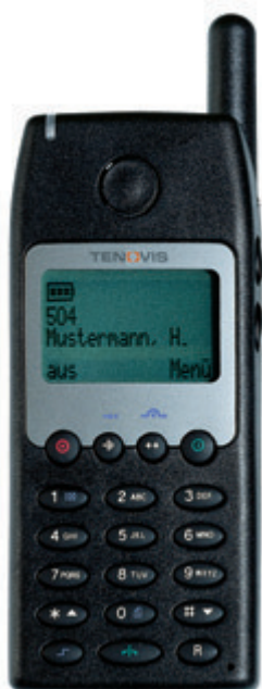
Schnurlos im Haus erreichbar: mit dem DECT-Handset MM 588 von Tenovis

S tändige Erreichbarkeit, mit direkter Durchwahl, ohne mehrmaliges Weiterverbinden und ohne lange Wartezeiten: Das ist der Kundenservice, den Anrufer heute erwarten. Wer dieser Erwartungshaltung entgegenkommen und sich entscheidende Wettbewerbsvorteile sichern will, hat die Lösung mit einem Mobiltelefon von Tenovis in der Hand.