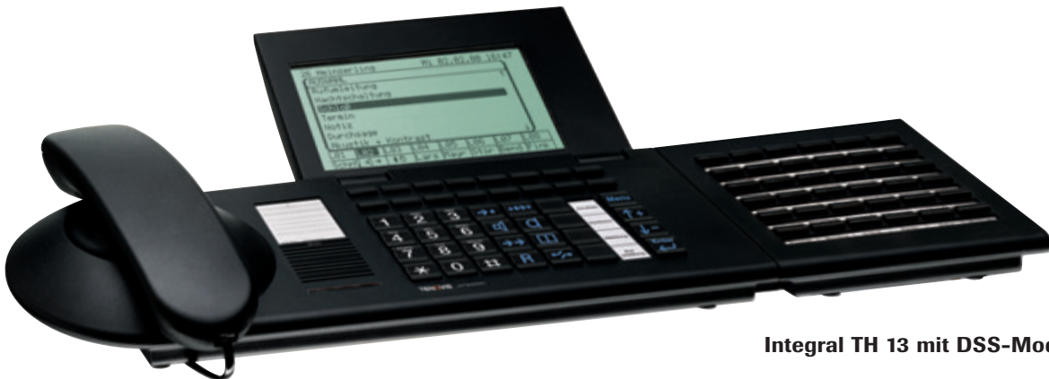
Integral TH 13 mit DSS-Modul

Mit einem DSS-Modul von Tenovis erweitern Sie Ihre Möglichkeiten. Bis zu drei Module können jeweils an die Telefone Integral TS 13, Integral TM 13 und Integral TH 13 angeschlossen werden. Damit stehen Ihnen bis zu 108 weitere Zieltasten zur freien Verfügung. Großzügige Platzhalter für die Tastenbeschriftung sorgen dafür, dass Sie dabei nicht den Überblick verlieren.