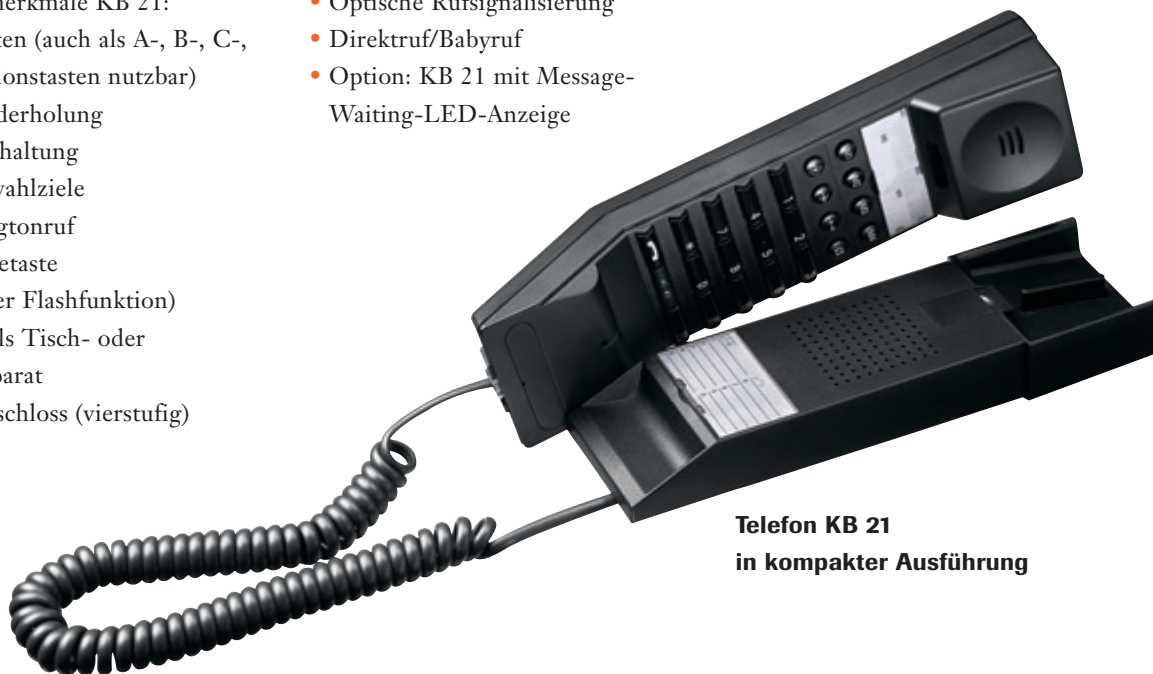
Telefon KB 21 in kompakter Ausführung