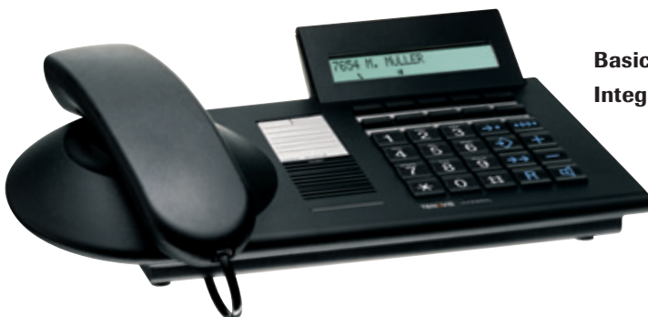
Basic-Telefon Integral TB 13