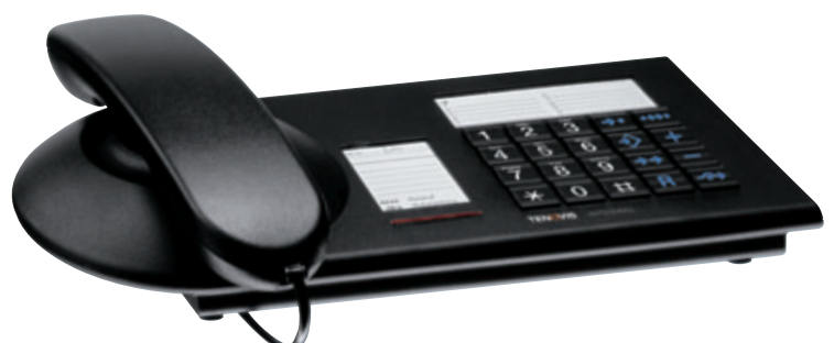
Economy-Telefon Integral TE 13