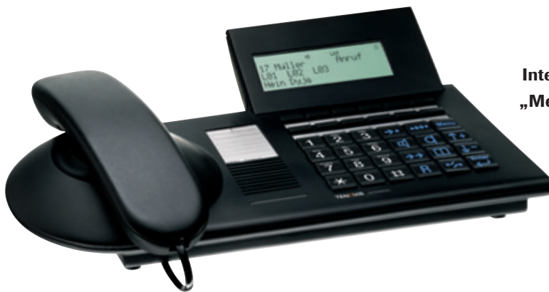
Integral TM 13 „Medium“