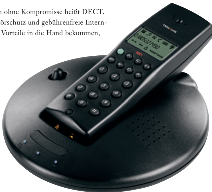
Digitale Sprachqualität bietet das CS 578