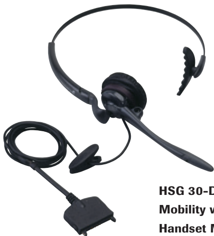
HSG 30-DECT: Das Headset für Mobility wird direkt an das Handset MM 588 gesteckt

Heute verbringen zwei Drittel aller Mitarbeiter den halben Arbeitstag am Telefon. Müssen sie während des Telefonierens noch einen Computer bedienen, wird das unter Umständen zu einer kleinen Herausforderung. Uneingeschränkte Bewegungsfreiheit ermöglicht hier ein Headset.