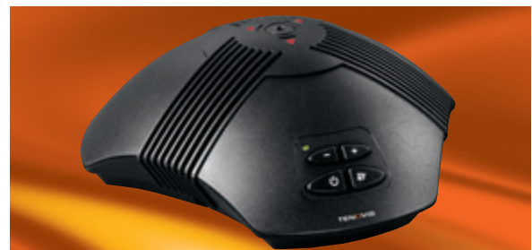
Die Conference-Unit von Tenovis mit ihrem interessanten Design erleichtert Besprechungen

Rundum ansprechend mit optimaler Tonqualität: Die Conference-Unit für die Integral T 1-Telefone von Tenovis erfüllt höchste Ansprüche beim Konferieren. Die Vollduplextechnologie ermöglicht freies Hören und Sprechen ohne Sprachumschaltung. Die digitale Prozessortechnik stellt sich automatisch auf die optimale Raumakustik ein. Die Conference-Unit ist einfach anzuschließen, sofort betriebsbereit und leicht zu bedienen.