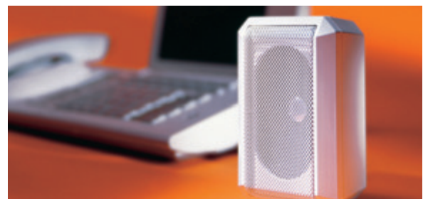
Zusatzlautsprecher – ideal zum Freisprechen und Mithören