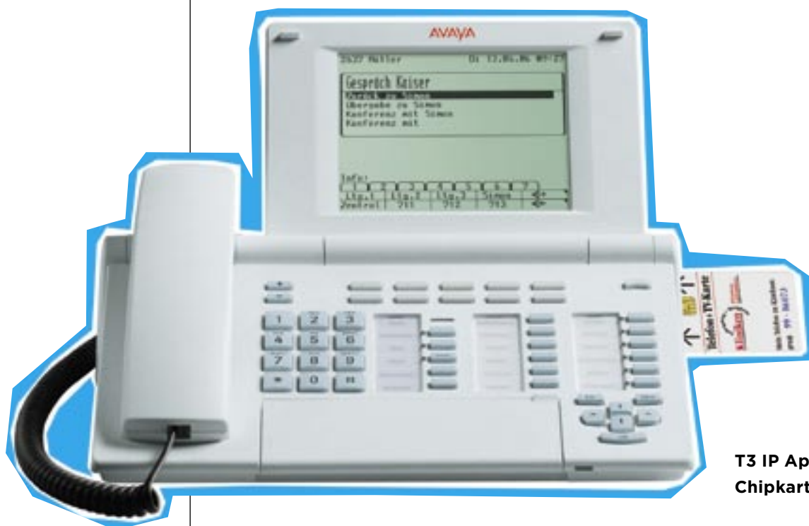
T3 IP Apparat mit Chipkarteneinheit

Programmupdates oder Änderungen der Einstellungen für das Terminal werden zentral vom Server aus durchgeführt. Ein aufwändiger Service in den Patientenzimmern, unter Umständen mit der Evakuierung des Zimmers verbunden, ist nicht erforderlich.