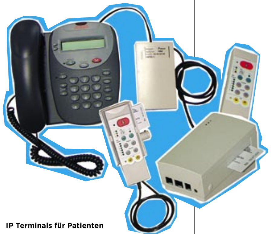
IP Terminals für Patienten

Da die IP-Chipkarteneinheit und die Bedieneinheit mit beliebigen IP-Terminals kombinierbar sind, kann der Kommunikationskomfort für die Patienten durch die Auswahl des Terminals gesteigert werden.