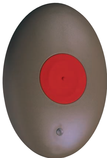
Funkfinger Fufi 950 in Originalgröße