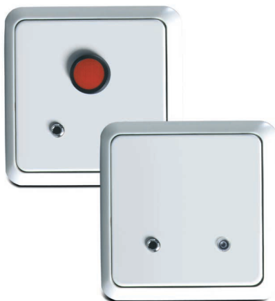
Wahlgeber WGE 2.1-Bad