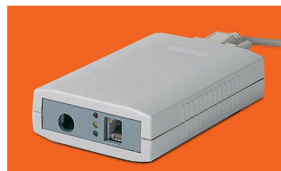
Programmiergerät für Wählgerät BWW 1

Immer mehr Alten- und Seniorenheime betreuen neben stationären Heimbewohnern auch zu Hause wohnende Senioren ihres Einzugsbereiches mit dem gleichen Pflegepersonal. Für diesen typischen SECOM-Kunden wurde das Wählgerät BWW 1 entwickelt. Im Zusammenspiel mit dem an der ISDN-Telefonanlage von Tenovis im Seniorenheim angeschlossenen Empfangsgerät erfolgt die Notrufsignalisierung kompatibel zu der stationären SECOM-Bewohner-Notrufsignalisierung.