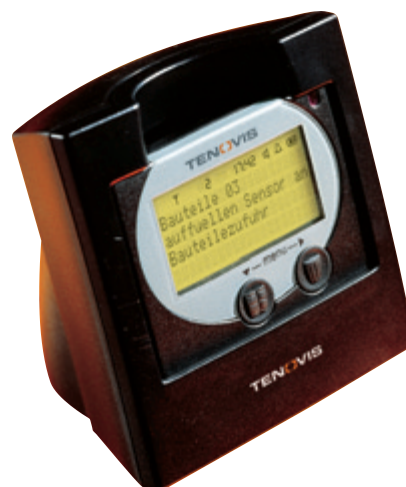
Tischladegerät CU 401

Tenovis John-E.-Kennedy-Straße 43-53 D-38228 Salzgitter