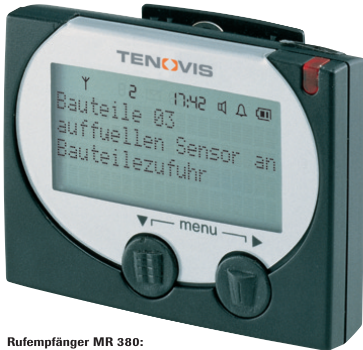
Rufempfänger MR 380: Seine Nachrichten sind klar und eindeutig