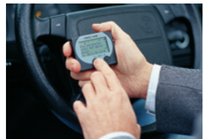
Rufempfänger MR 380 D: auch unterwegs immer erreichbar