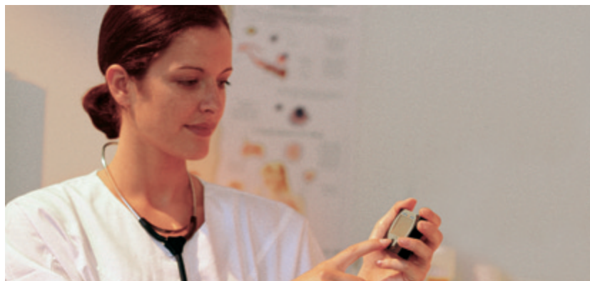
In dringenden Fällen die wichtigen Informationen auf einen Blick