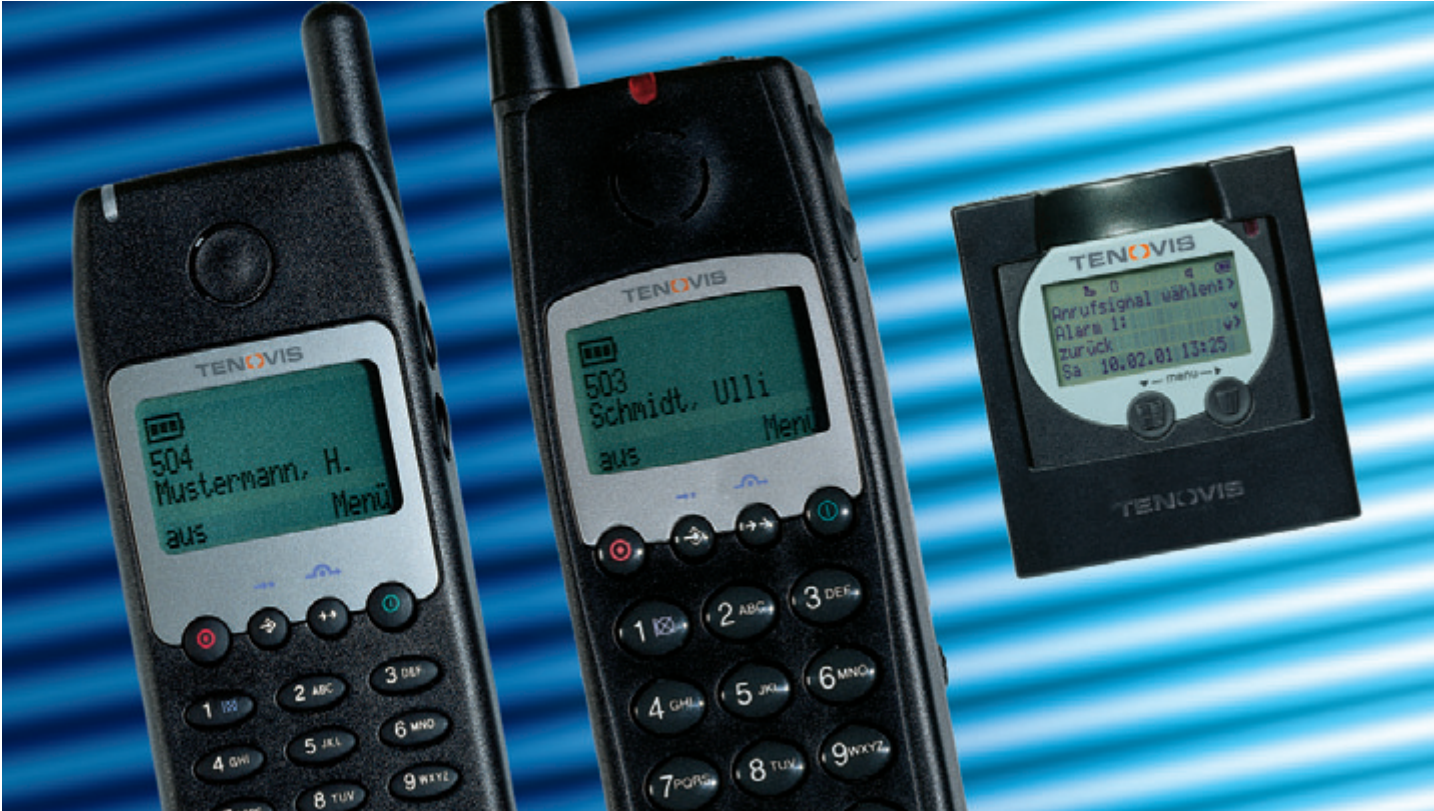
Das Trio zur Unabhängigkeit: DECT Handset MM 588, MM 780, MR 380

„Ein gutes Gefühl zu wissen, daß ich nichts mehr verpasse“